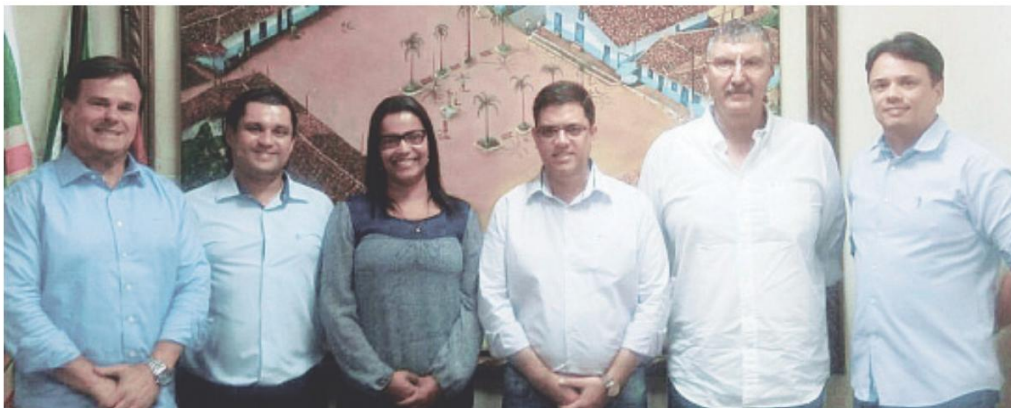
A diretoria da ACE com o Prefeito Marcos Neves e sua Vice Gilmar Gonçalves (ambos ao centro)

O Prefeito prontamente informou que será retomado o serviço até o final do mês de março e que o mesmo foi temporariamente fechado em razão da necessidade em concentrar esforços na segurança no depósito de medicamentos de alto cus-