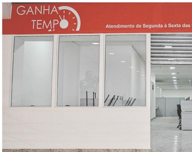
Atendimento das 8h15 às 16h

A partir de agora a ACE estará apoiando e sediando Mutirões de Emprego em Carapicuíba visando contribuir na diminuição do desemprego na cidade. Fará intermediação entre seus associados em busca de vagas a serem preenchidas. Nosso objetivo é ajudar no preparo e qualificação dos candidatos e resgatar a autoestima dos mesmos. Mais informações ligue: 4184-7199.